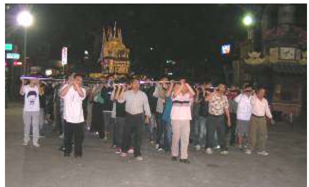
圖八 敦和宮前整合練習剪影