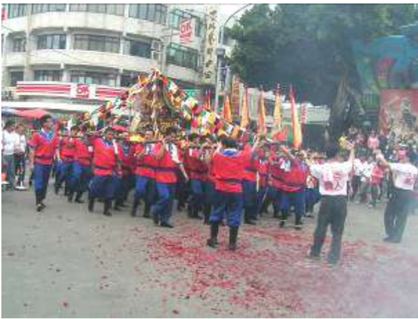
圖十五 遊街安全回駕剪影