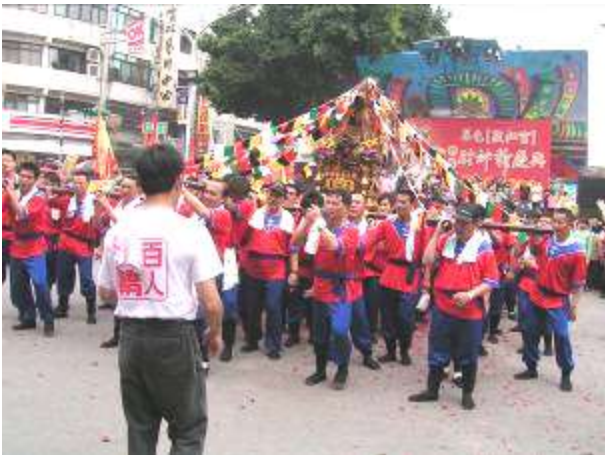
圖十 三進三退拜廟剪影