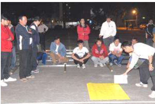
圖五 轎夫固定位置分配講解剪影

在訓練前期（3月30日前）將訓練時間分白天（學生）及晚間（里民）兩個時段練習；訓練後期整合於敦和宮前廣場，實地練習。另外，因為分兩個時段練習，所以必須固定轎夫位置，方便後期整合。