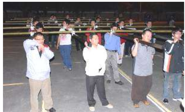
圖七 晚間訓練剪影