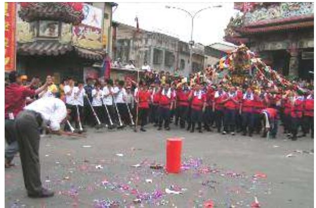
圖十二 鳴炮起轎剪影