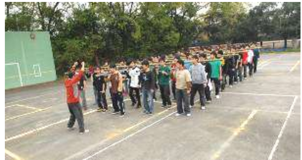
圖六 白天訓練剪影

「百人大轎」是為慶祝敦和宮財神誕辰的創新慶典活動。不論「參與同時一起扛轎人數」、「神轎結構」或「拜廟儀式」都屬全國唯一。但在轎夫招募不如預期順利，又有成功熱鬧出巡演出的時間急迫性等因素必須克服。因此，在練習期間，與熱心參與此次活動的夥伴們，經過幾次商討後確定，「拜廟儀式」採「齊步三進三退」、「360°轉圈」及「定點舉轎三次」等動作，輔以「哨聲」及「口號」演出。「出巡遶境活動」以「齊步」、「哨聲」、「口號」、「路口轉圈」及「舉轎行進」等動作變換出巡。