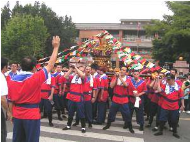
圖九 敦和國小起轎回宮剪影

100年4月17日上午8時神轎在敦和國小開始組裝，轎夫們也陸續報到、確認扛轎位置及換裝。11時準時起轎回宮迎接財神爺聖駕。