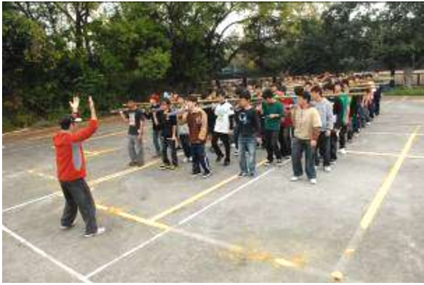
圖三 白天練習剪影圖