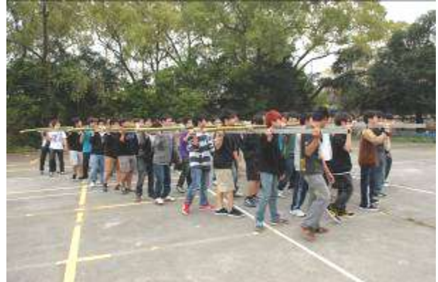
圖二 簡易模擬練習轎圖

在思考與討論後，確定以五支方形不銹鋼為直槓，以六支竹竿為橫槓，用童軍繩網綁紮牢組合而成。完成組合後練習轎，如圖二所示。