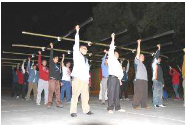
圖四 晚間練習剪影圖