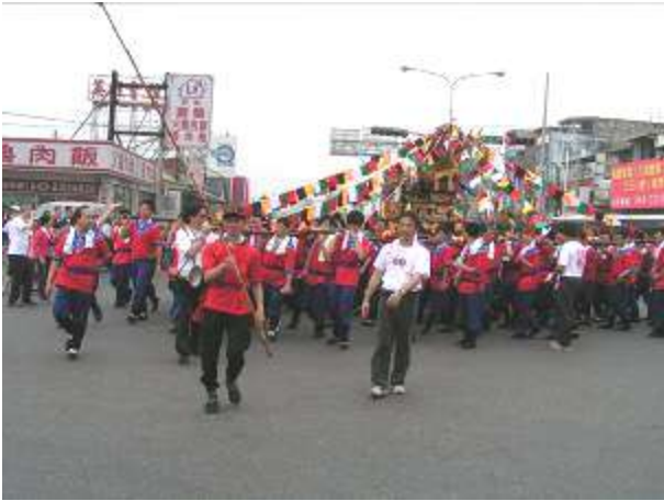
圖十四 遊街路口轉動演出剪影