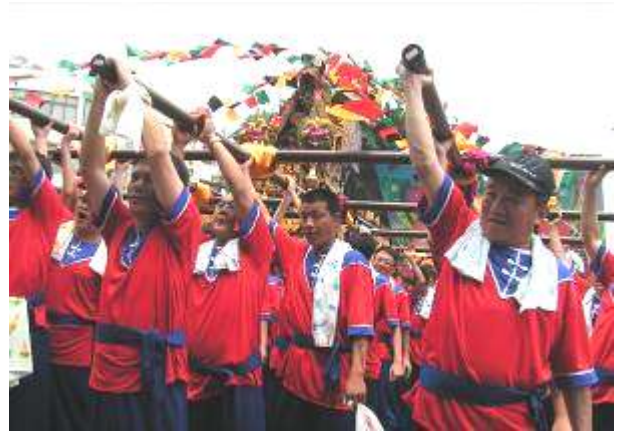
圖十一 舉轎拜廟剪影